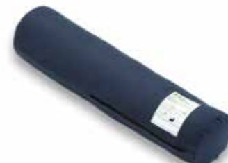
サポーターングロール S