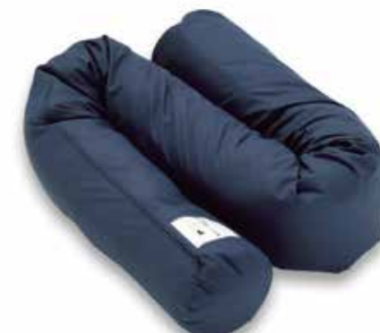
サポーターングロール L