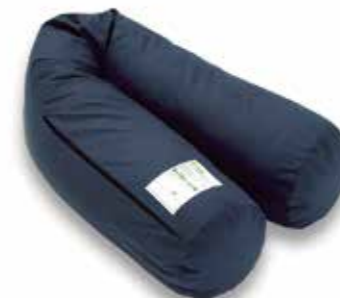
サポーターングロール M