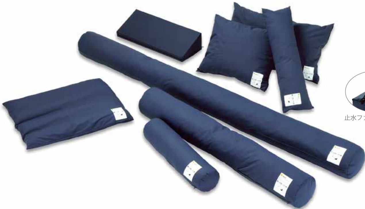
止水ファスナーを採用