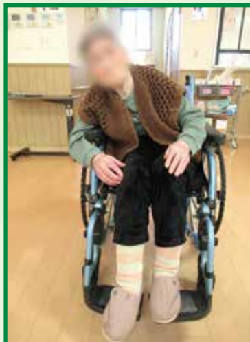
レベリングプレートアウター (未使用)