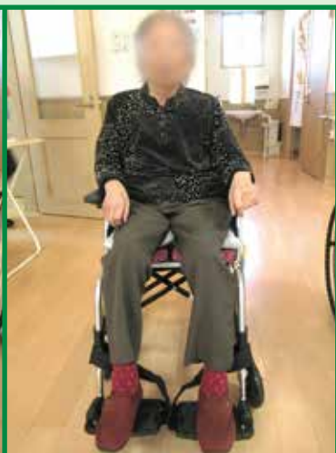
レベリングプレートアウター 使用中