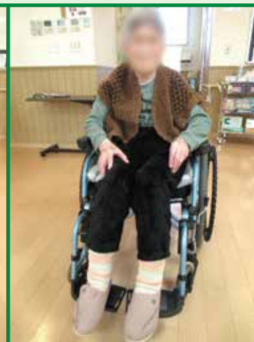
レベリングプレートアウター 使用中