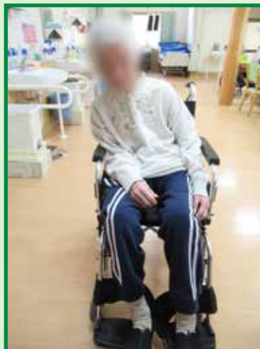
レベリングプレートアウター (未使用)