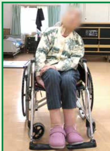
レベリングプレートアウター (未使用)