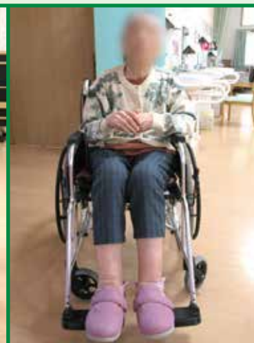
レベリングプレートアウター 使用中