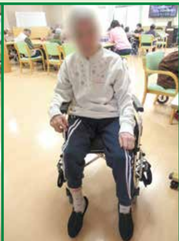
レベリングプレートアウター 使用中