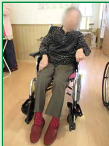
レベリングプレートアウター (未使用)